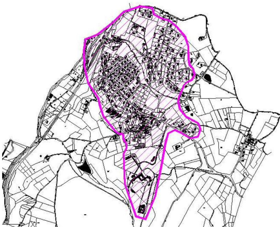
Zone de collecte sur la commune de Eveux

Un zonage d'assainissement a été réalisé en 2006.