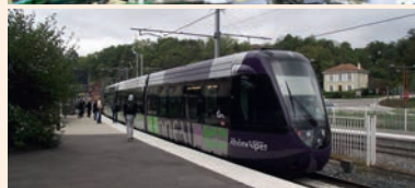
L'atelier de maintenance du tram-train