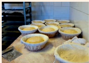
Les mains à la pâte

RÉSERVATION OBLIGATOIRE (nombre de places limité) AU GUICHET OU PAR TÉLÉPHONE.