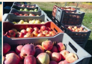
La Pomme, plaisir d'automne