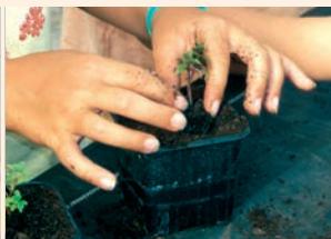
Découverte sensorielle du jardin